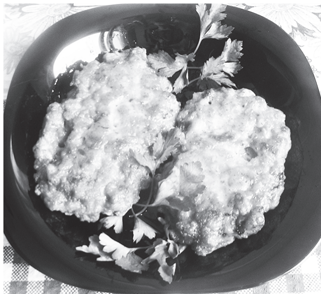
Мясо по-албански готово. Приятного аппетита!

Затем перевернуть котлеты и жарить так же, несколько минут, с другой стороны. (Можно сперва подержать котлеты под крышкой, 3-4 минуты с каждой стороны, а затем дожарить без крышки, до румяной корочки.)