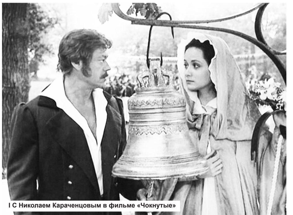
I С Николаем Караченцовым в фильме «Чокнутые»

- Из уст великих педагогов - Алексея Баталова, Анатолия Ромашина, Бондарчука, Скобцовой - мы узнавали азбуку актерского мастерства. Штудировали системы Станиславского и Михаила Чехова, серьезно занимались сценической речью. Помню, на первом курсе ездила на метро с полным ртом лесных орехов в скорлупе - отработывала артикуляцию... Уверена, школа важна для актера: мы должны уметь говорить, слушать, слышать, двигаться, быть на съемочных площад-