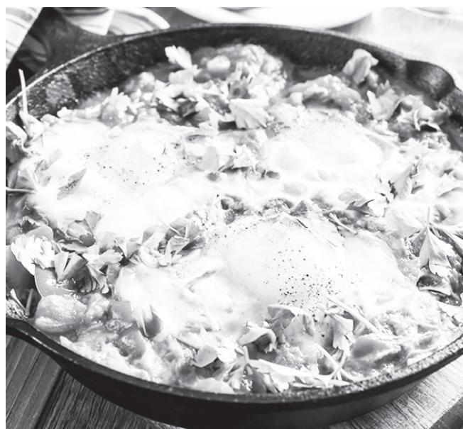
Шакшука со свежими помидорами готова. Подаем, посыпав зеленью. Приятного аппетита!

В овощной массе с помощью ложки делаем три углубления. В эти углубления разбиваем яйца и немного их солим. На медленном огне готовим еще 5-7 минут. За это время белок должен полностью схватиться, а желток остаться жидким.