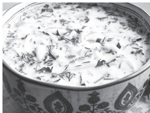
минеральной газированной водой. Затем добавить сметану.

Желтки соединить с горчицей и размять вилкой. Зеленый лук посолить и растереть толкушкой. Желтки и зеленый лук добавить к остальным ингредиентам. Влить кефир. Залить