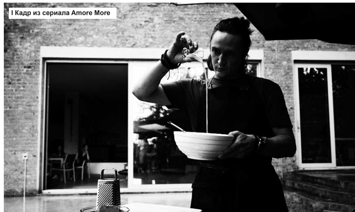
1 Кадр из сериала Amore More

- Учитывая мой длинный язык и неосторожность с журналистами. (Смеется.) Ну да.