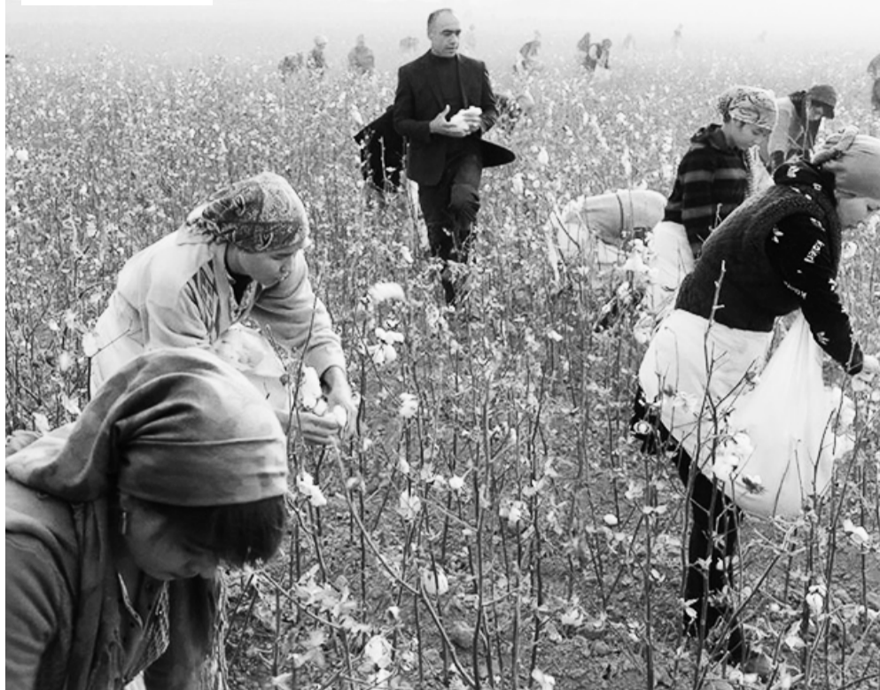
I Кадр из фильма