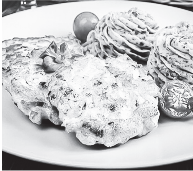
Подать куриные рубленые котлеты горячими. Приятного аппетита!

С помощью столовой ложки выкладывайте массу на разогретую сковородку. Жарить куриные котлеты на подсолнечном масле с двух сторон по 2-3 минуты, до зажаристой корочки.