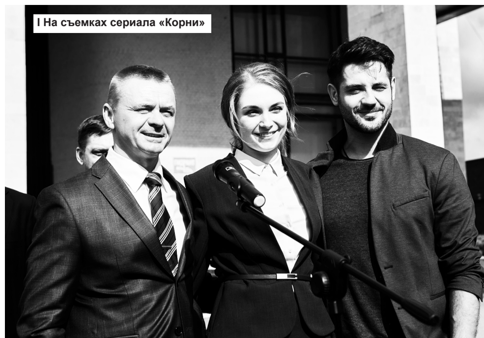
I На съемках сериала «Корни»