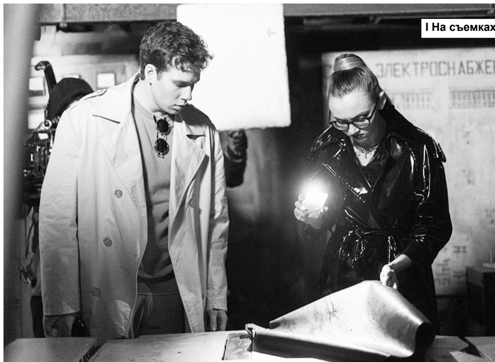
На съемках сериала «1703»